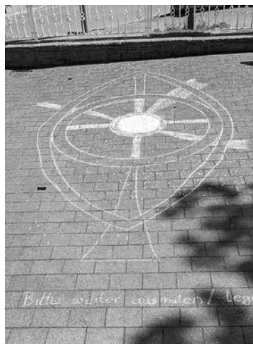
Fronleichnam, vorher und nachher - die Ennester Kinder gestalteten und schmückten ihren „Teppich“.