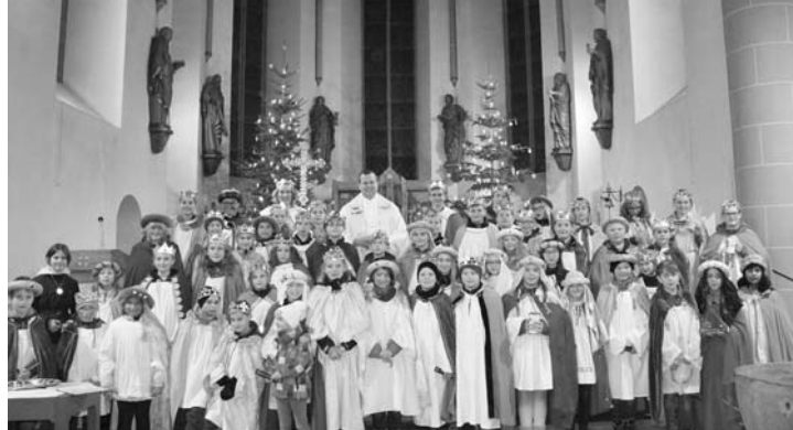
Die Attendorfer Sternsinger in der Pfarrkirche