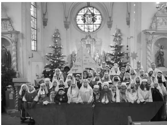
Sternsinger aus Ennest und Neu-Listernohl