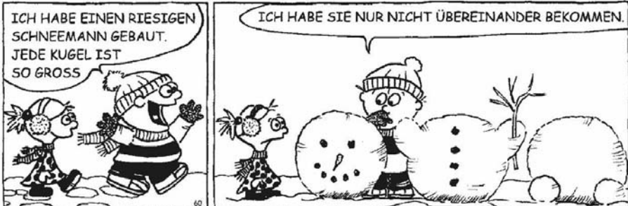
Comic: Image 1/2010 Bergmoser+Höller-Verlag