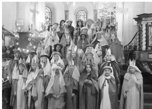
Sternsinger aus Helden und Dünschede