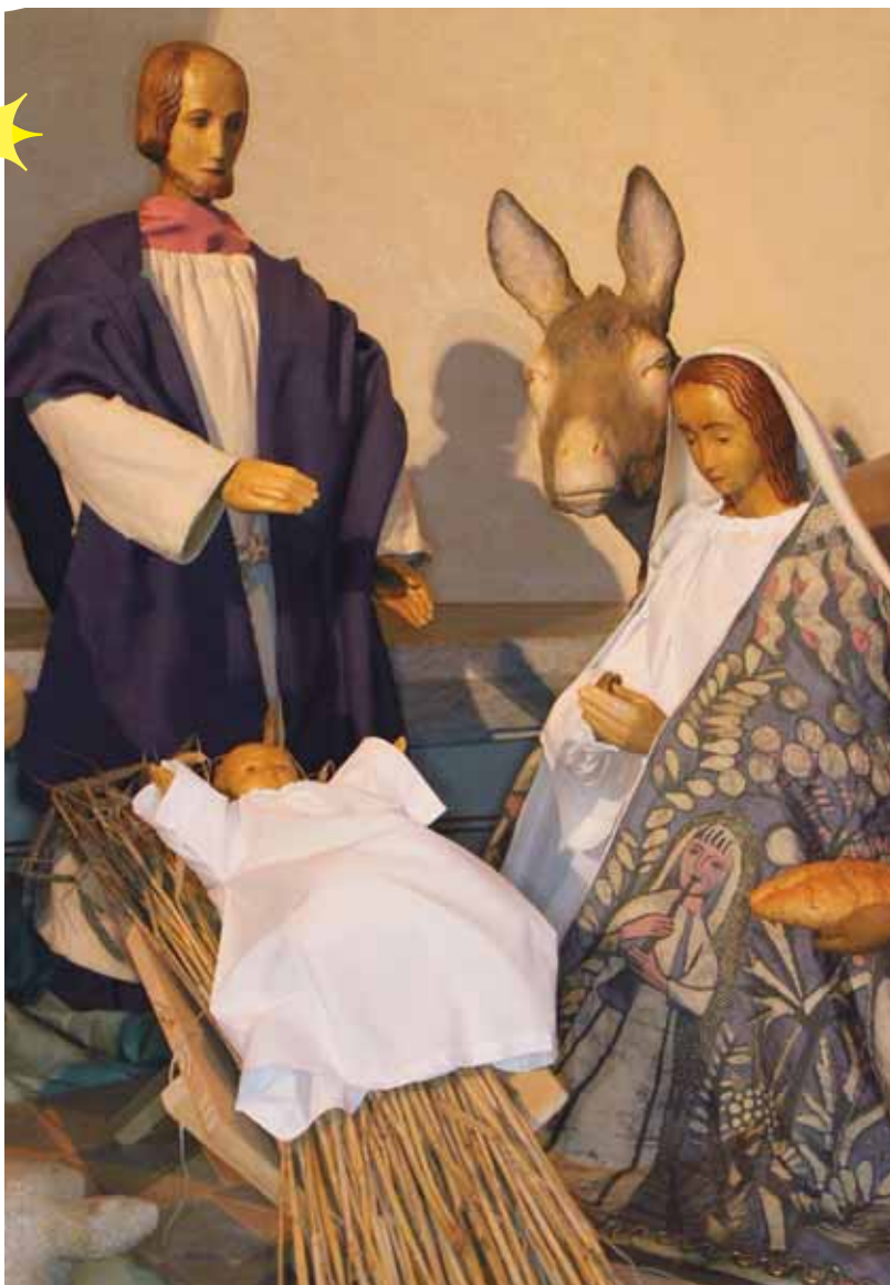
Heilige Familie der Pfarrkirche St. Johannes Bapt. Attendorn